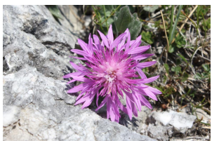
Centaurea montis-borlae Endemica Apuana