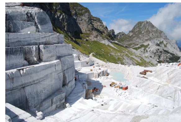
Passo della Focolaccia Un tempo 1.680 s.l.m.